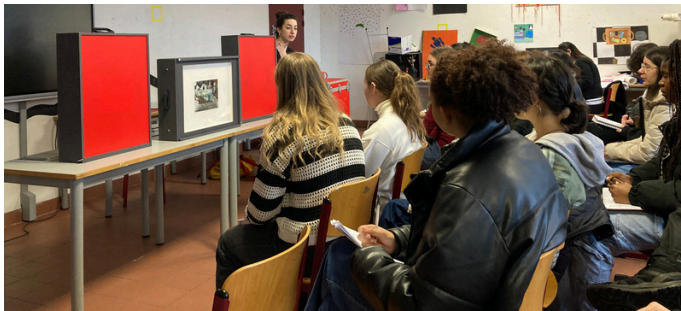
Initiation à la lecture et à l'analyse d'œuvres par les intervenants du FRAC Ile-de-France qui apportent des œuvres au lycée

La classe de Seconde est l'occasion d'une pratique variée, on expérimente différentes techniques (dessin, peinture, photo-montage, volume, travail numérique...) en réponse à des incitations précises, dans un cadre horaire de 2 h minimum