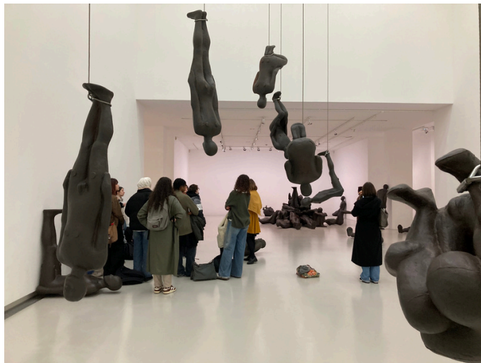
Visite-conférence de l'exposition GORMLEY au Musée Rodin en 2024, avec la Première Spécialité