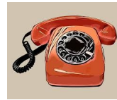
Antonio Meucci : le téléphone