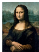
Pas besoin de présentation...