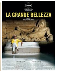
Il cinema : de Fellini a Sorrentino