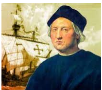
Christophe Colomb : la découverte de l'Amérique

• L'Italie est... un grand nombre de femmes et d'hommes qui ont marqué l'histoire mondiale grâce à leurs inventions et découvertes :