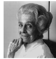
Rita Levi Montalcini : les découvertes dans la médecine